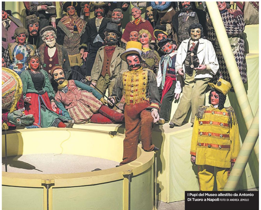
I Pupi del Museo allestito da Antonio Di Tuoro a Napoli

Negli ambienti restaurati sotto Santa Maria La Nova «dormono» guappi, camorristi e paladini, la dolce Angelica, il feroce Saladino... tutti di legno. Un patrimonio riscoperto da Alberto Baldi, nello spazio allestito da Antonio Di Tuoro non accessibile al pubblico