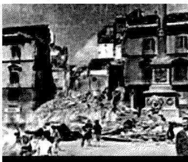
Due immagini a Napoli durante la Seconda Guerra Mondiale Sopra un palazzo abbattuto